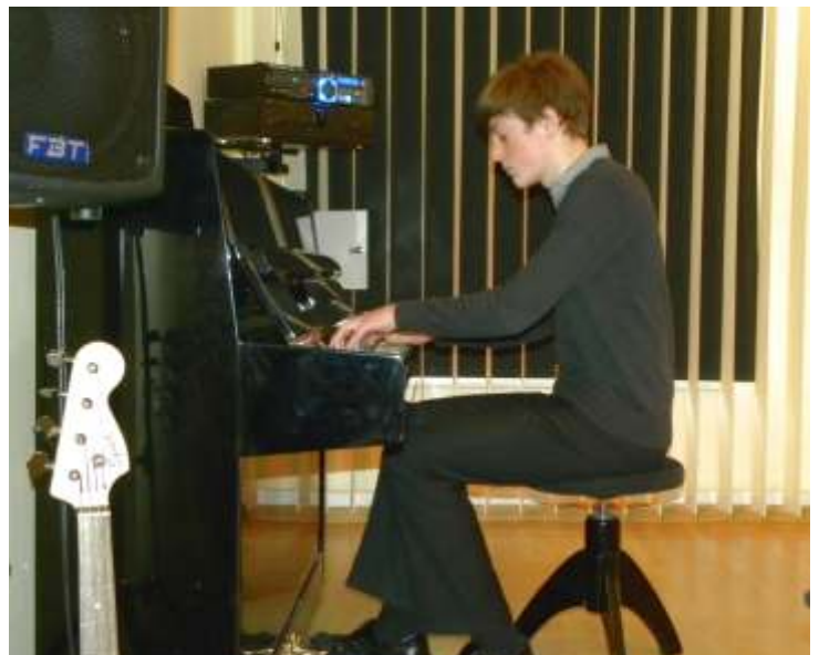
- Lubi dla was gra - pomyślał młody pianista