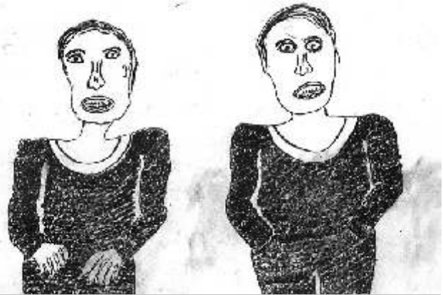
Bez tytułu, Krzysztof Aniołek

RECENZJA NAJNOWSZEJ WYSTAWY W GALERII "TAK"