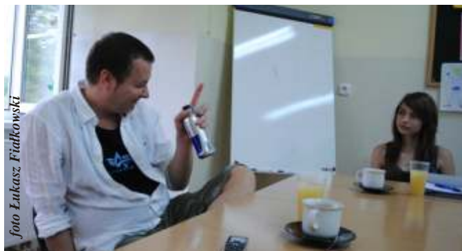
Przed spotkaniem z Graba em byli my troch spi ci. Zupelnieniepotrzebnie. Atmosfera była luzacka.

- Ka dy twórca ma momenty takiego zablokowania si . Te momenty nawarstwiają si wraz z wiekiem. Kiedy człowiek był młody, to miał wi cej czasu. Na wszystko miał czas. A poza tym nie miał tych do wiadczyc , które ma ma człowiek w moim wieku. Podejrzewam, e tego co mógłbym napisa , jak byłem młody, teraz nie byłbym w stanie.