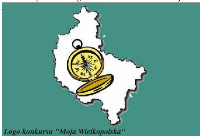
Logo konkursu "Moja Wielkopolska"

Po zmaganiach z wikliną przyszedł czas na zajęcia plastyczne, które polegały na malowaniu ceramicznych figurek przedstawiających rodzime gatunki roślin i zwierząt. Pięknie pomalowane figurki, których powierzchnię zabezpieczono specjalnym lakierem, stały się dla wszystkich pięknymi pamiątkami z Łądu.