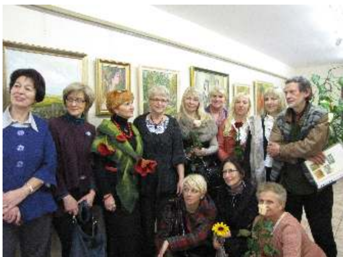
Artyści, którzy wystawiali swoje prace na wystawie w galerii "Pod Arkadami".