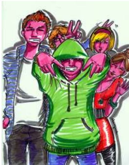
Liceum w. Marii Magdaleny - - miejsce dla Olimpijczyków?

W tym numerze zaczynamy od tzw. górnej półki - zapraszamy do bli szego poznania Liceum w. Marii Magdaleny, które odwiedziła Agnieszka Jarosz, oraz Liceum Ogólnokształc ce nr 1 im. Karola Marcinkowskiego, któremu przyjrzała si Anna Starczewska.