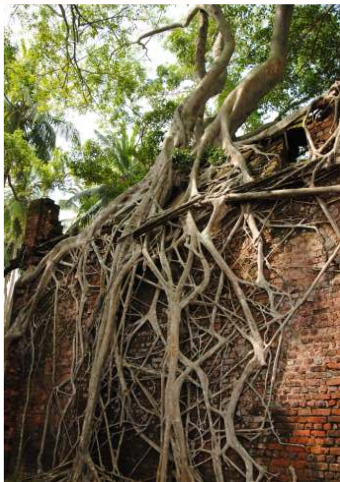
Wyspa Ross i ruiny miasta kolonialnego pochłoni te przez d ungl