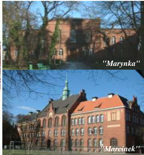
Lubisz matematyk i fizyk ?

- Wybrałam to liceum, poniewa chodził do niego mój brat i bardzo je lubił. Poza tym liczyłam na poznanie ludzi z którymi mam jaki wspólny j zyk, którzy maj podobne zainteresowania i podejcie do ycia.