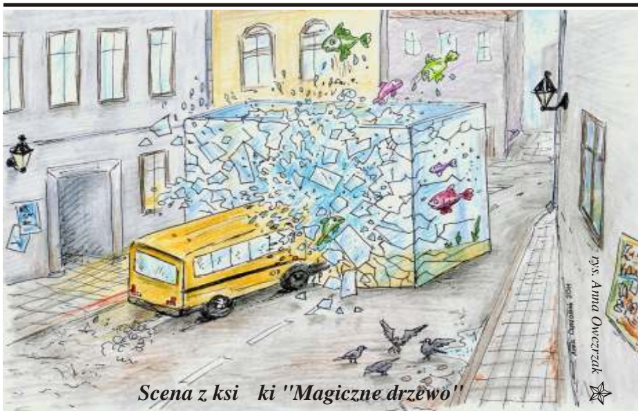
Scena z ksi ki "Magiczne drzewo"

Mechaniczna Magdalena - film fabularny TV. Produkcja TP