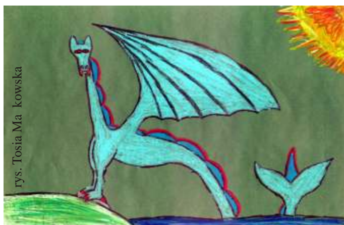
rys. Tosia Małkowska

Zwierzę to przypomina smoka z bajek dla dzieci, lecz zamiast tylnych łap posiada ogon i płetwy biegnące przez całą długość jego ciała, co ułatwia mu pływanie. Potrafi latać, ale w locie często zderza się z owa-