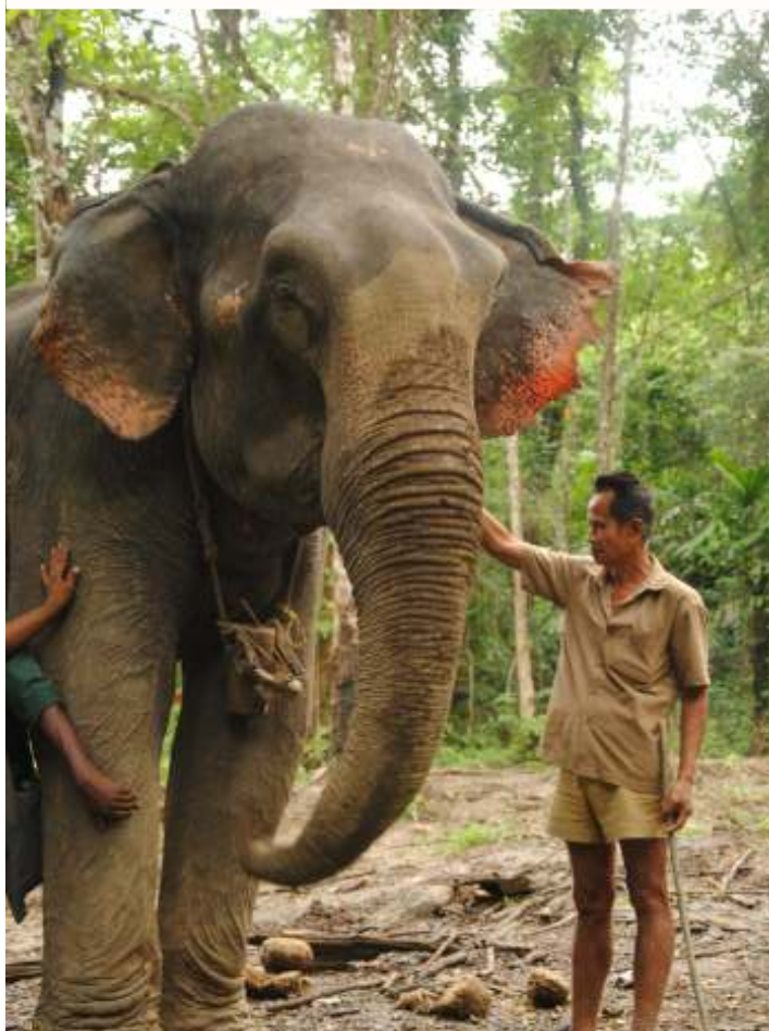
Słó pracuj cy dla rz dowego le nictwa z trenerem-opiekunem na wyspie Middle Andamans