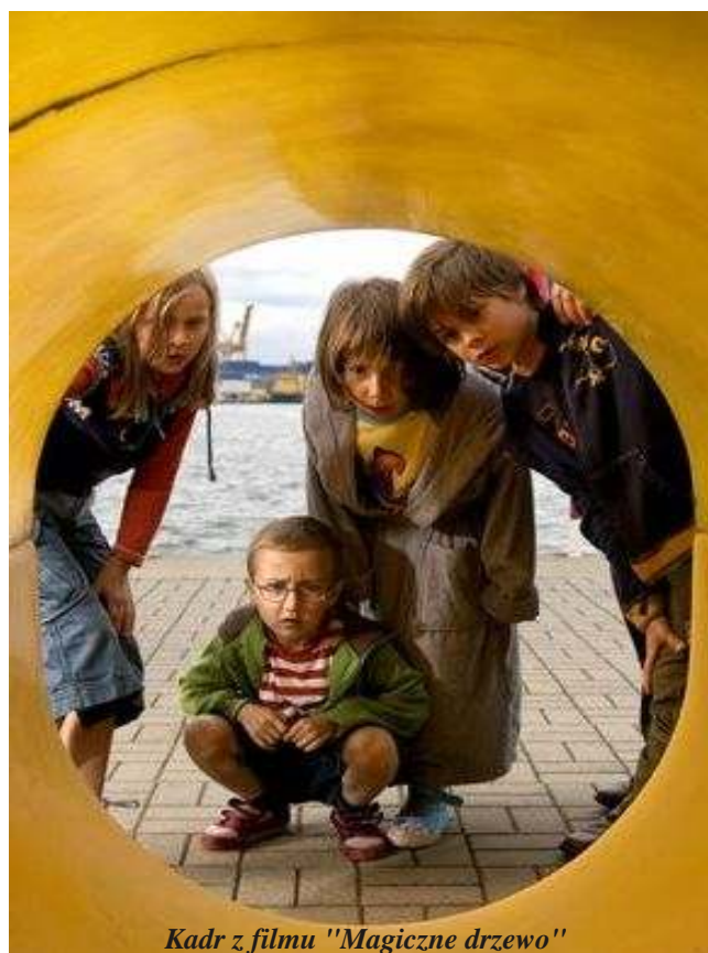
Kadr z filmu "Magiczne drzewo"

W 1998 r. pozna ska redakcja "Gazety Wyborczej" nagrodziła Andrzeja Maleszk "Gigantem" przyznawanym za "pozna ski styl pracy". Znalazł si tu w towarzystwie m.in. Tadeusza Mazowieckiego, o. Jana Góry i himalaisty Krzysztofa Wielickiego.