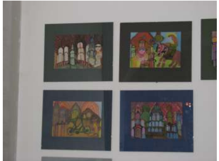
Prace Henryka arskiego