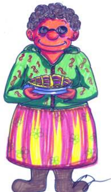
Babcia Czerwonego Płaszczyka

Prawie w tej samej chwili Wolfowi wreszcie udało się odpalić silnik. W tym samym momencie zobaczył w tylnym lusterku Jacka ze rubonkami w ręce. Rozejrzał się głono, bo