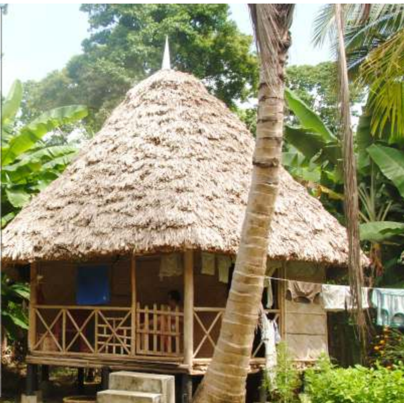
Uczestnicy wyprawy zorganizowanej przez Ilon Szymoniak mieszkali w takich wła nie chatkach bambusowych na wyspie Neill