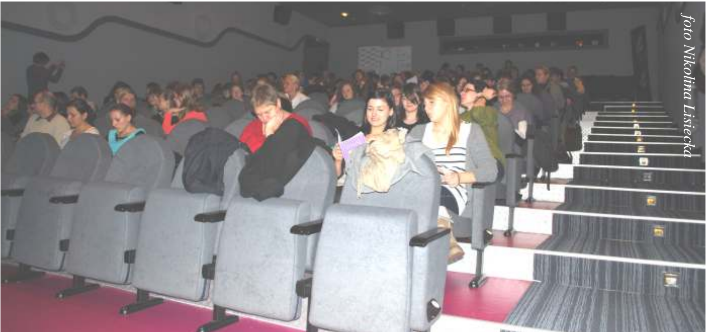
Uczniowie gimnazjów i liceów z całej Wielkopolski na Kongresie Młodych Dziennikarzy w poznańskim kinie "Muza"

Dobry reportaż to sama prawda i fakty. Zero kłamstw. A redakcja gazety to tak naprawdę całe miasto, w którym pracuje dziennikarz - mówili redaktorzy "Głosu Wielkopolskiego" podczas spotkania w kinie "Muza"